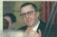
Carlos Alexandre é o juiz

❑ A instrução do processo de Tancos continua hoje com a inquirição de mais arguidos. O juiz Carlos Alexandre agendou a inquirição dos 23 arguidos até meados de fevereiro. Alguns não querem falar. ●