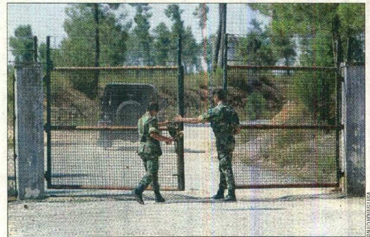
Paíóis de Tancos foram assaltados em meados de junho de 2017

❑ A acusação do Ministério Público sustenta que o caso, que começou num assalto a Tancos, se complicou depois da PJ Militar ter participado na encenação da descoberta, apenas para passar a perna à PJ. ●