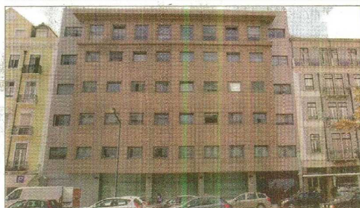
A investigação ao furto e aparecimento das armas foi realizada pelo DCIAP