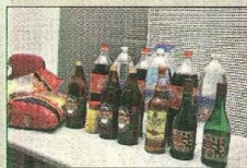
Bebidas que tinham na casa

Os sete jovens arrendaram uma casa para o fim de semana de 14 e 15 de dezembro de 2013. Nessa habitação foram encontradas garrafas de bebidas alcoólicas, entre outros bens.