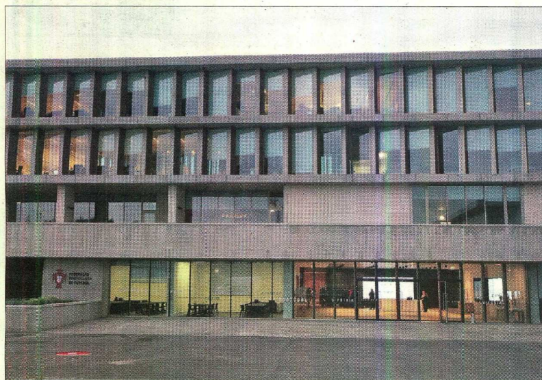
Federação Portuguesa de Futebol é um dos alvos do grupo de piratas informáticos que atacou ontem a APAF