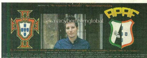
Página da APAF ficou com a fotografia de Rui Pinto ladeada de emblemas

A página da APAF foi atacada cerca das 05h00 da madrugada de ontem, mas o ataque só foi detetado por volta da hora de almoço, tendo sido resolvido cerca das 15h30. No site aparecia uma fotografia de Rui Pinto - o pirata português preso preventivamente (ver apoios) - ladeada pelos emblemas da FPF e da APAF, bem como um texto de apoio ao hacker, criticando a Justiça portuguesa por não investigar a corrupção no futebol