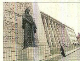
Relação do Porto decide escusa